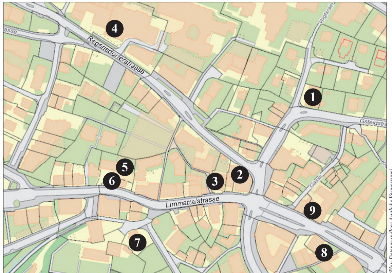
(Plan: Datengrundlage: Amtliche Vermessung)

• Marroniverkauf der UBS, ein Franken für rund zehn Stück, der Erlös geht an die Theodorastiftung. • Instrumental-Jazz mit dem Jazz Circle Höngg um 19.30 Uhr.